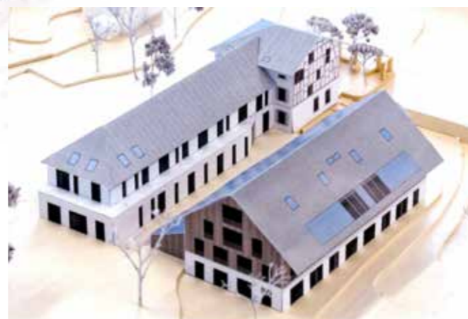
Modell Ansicht Seite Hürdli