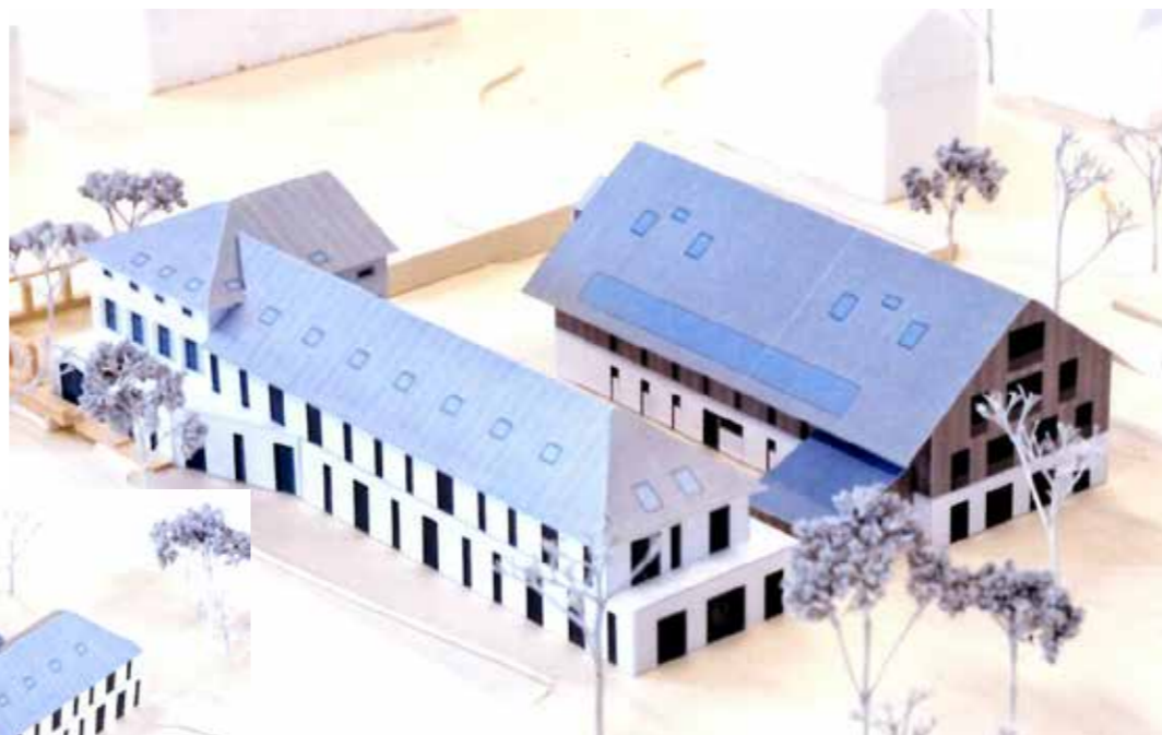
Modell Ansicht Seite Im Grund