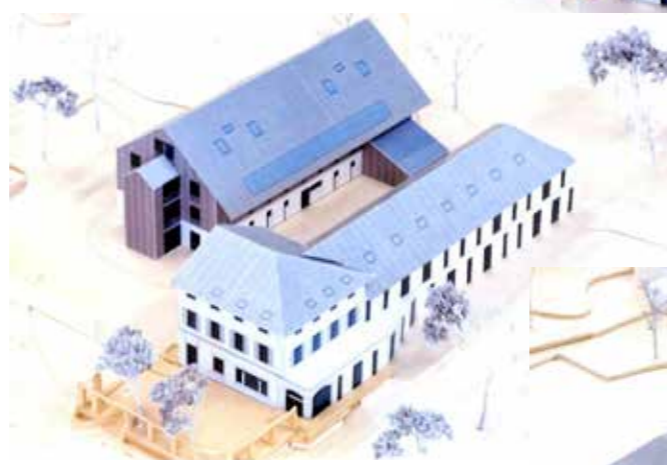
Modell Ansicht Seite Landstrasse West