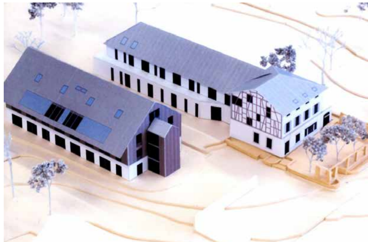
Modell Ansicht Seite Landstrasse Ost

Nun rückt der Um- und Neubau des Steinhof's doch ein beträchtliches Stück näher. Notwendige Änderungen im Projekt wurden vorgenommen, bei der Bauverwaltung eingegeben und von dieser für gut befunden. Die Gemeinde steht hinter dem Projekt und nun geht es 'nur' noch darum, das finale o.k. von der kantonalen Behörde zu erhalten. Dann kann der langersehnte Startschuss zum neuen Steinhof endlich erfolgen.